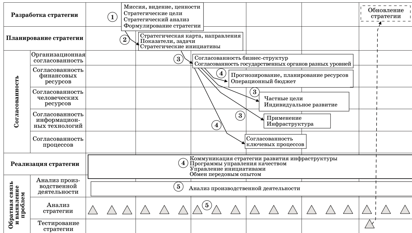
Рис. 4. Управление стратегией развития ОЭЗ ТРТ (номера, обведенные кружками, представляют этапы стратегического управления: 1 — разработка стратегии, 2 — планирование стратегии, 3 — организационная согласованность, 4 — планирование операционной деятельности, 5 — мониторинг и выявление проблем)