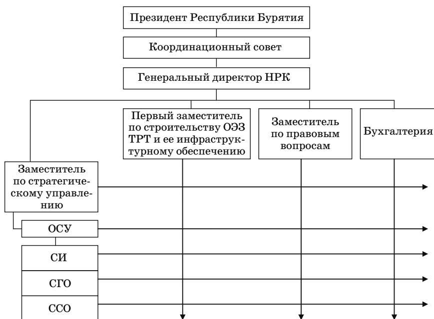
Рис. 2. Обеспечение вертикальных и горизонтальных отношений и связей при создании ОЭЗ ТРТ