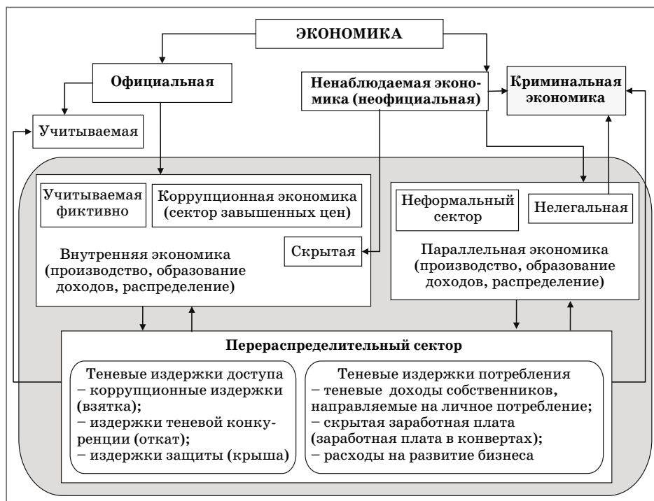
Рис. 2. Структура экономики

– нелегальная экономика (non-legall economy) — деятельность, не запрещенная законом, но официально не зарегистрированная и не учитываемая (нелегальная торговля дикими животными, культурными ценностями; нелегальный рынок автотранспорта («конструктора», перегон и продажа автомобилей); деятельность по выпуску различных разрешенных видов продукции и оказанию услуг и т.д.). Основной целью субъектов нелегальной предпринимательской деятельности этого сегмента является незаконное обогащение.