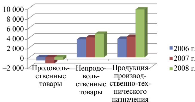
Рис. 1. Сальдо ввоза-производства продукции и товаров Республики Бурятия, млн р.

Анализ формирования товарных ресурсов Республики Бурятия за три года показал превышение в денежном выражении ввозимой продукции над производимой в регионе, за исключением продовольственных товаров (рис. 1).