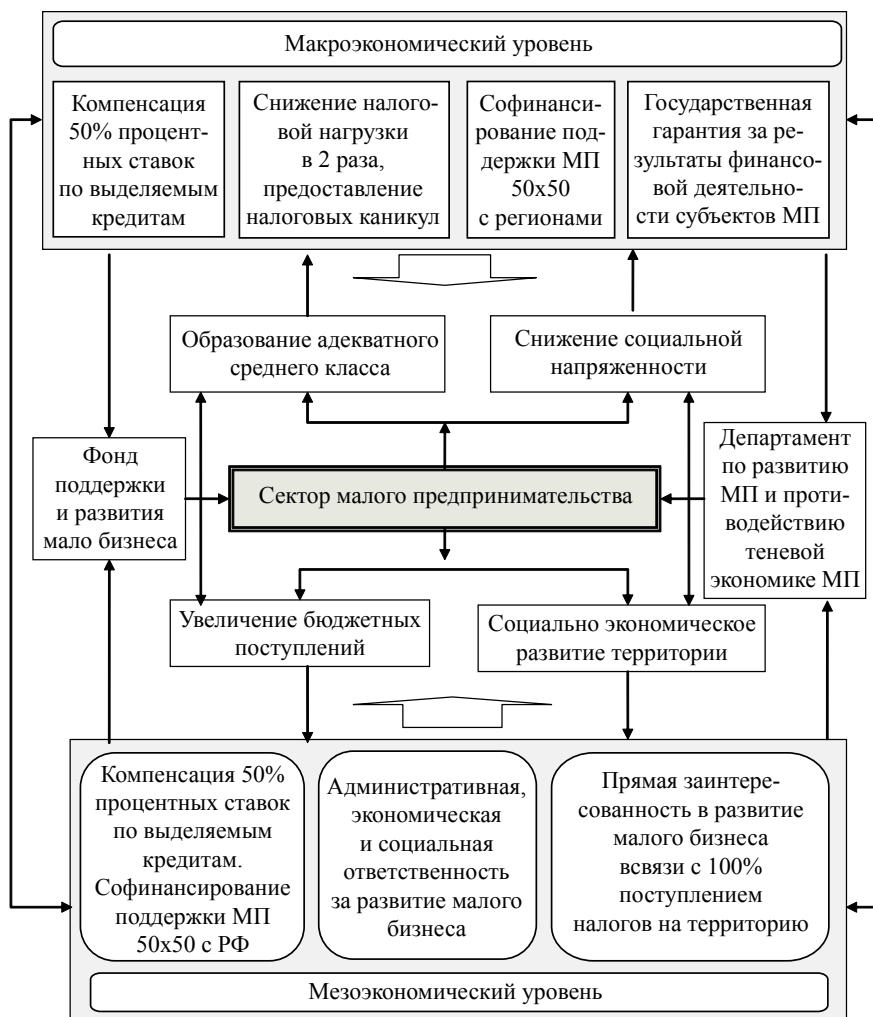
Рис. 2. Экономический механизм поддержки официальной деятельности субъектов МП и противодействия их теневым отношениям

Для повышения эффективности деятельности субъектов МП в официальном секторе экономики предполагается введение принципа прямой заинтересованности регионов в их деятельности, что предусматривает следующее: