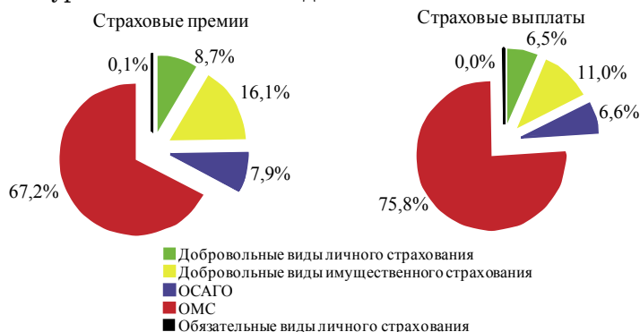
Рис. 2. Структура страхового рынка Иркутской области по итогам 2009 г. (составлено по данным: [1])

На втором месте в структуре рынка по сбору страховых премий находится сегмент имущественного страхования, доля которого к 2009 г. снизилась на 4,7%. Страховые премии в данном сегменте в сравнении с 2008 г. уменьшились на 15%. При этом страховые выплаты в имущественном страховании выросли на 29,4%. Это соответственно привело к увеличению уровня выплат с 33% до 50%.