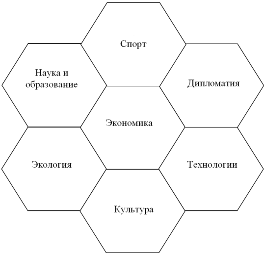
Рис. 2. Основные компоненты ресурсной базы «мягкой силы» страны