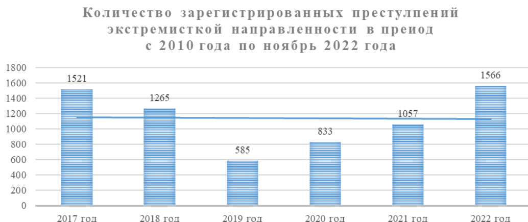
Рис. 1. Количество зарегистрированных преступлений экстремистской направленности в период с 2010 г. по ноябрь 2022 г.

Криптовалюта, как ни один другой финансовый инструмент, может способствовать развитию экстремистских организаций и сообществ. Согласно с мнением Ю.А. Грачева и И.В. Степанова о том, что внедрение криптовалют положит начало длительному процессу усиленного развития финансирования терроризма и экстремизма [9, с. 76]. Данная проблема представляет опасность, и предпринятые меры, хоть и являются ощутимыми, все же недостаточны в стремительно развивающемся секторе использования криптовалют. Динамика преступлений экстремистской направленности, по данным Генеральной Прокуратуры Российской Федерации, представлена на рис. 1 5 .