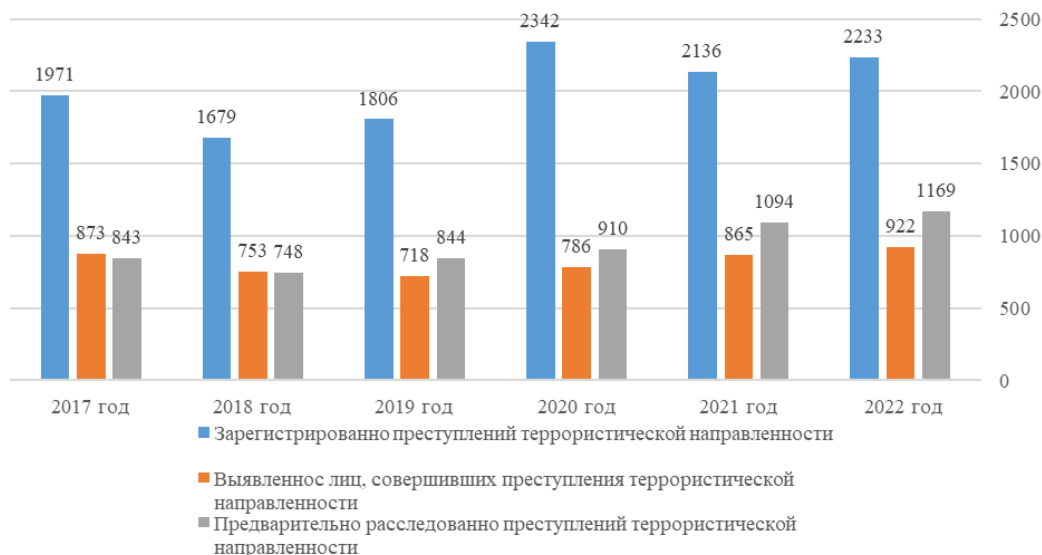
Рис. 2. Состояние преступности террористической направленности в России за период 2017–2022 гг.

Так, в целях борьбы и предотвращения трагедий вопросы противодействия терроризму зафиксированы в основополагающих документах, определяющих стратегию национальной безопасности. На основании международных обязательств и в целях своей защиты в России установлена строжайшая уголовная ответственность за терроризм и различные его проявления. Ответственность предусмотрена ст. 205, 205.1, 205.2, 205.3, 205.4, 205.5, 206 УК РФ. Статистика преступлений террористической направленности в России выражена на рис. 2 9 .