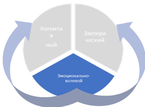
Рис. 2. Вера, где когнитивный и эмпирический компоненты ослабевают

В случае, когда наполнение эмпирического и когнитивного компонента таково, что, компоненты в конструкте вступают в конфликт (неизлечимая болезнь, отсутствие возможности на благоприятный исход в обозримом будущем значимой для субъекта проблемы), эмоционально-волевой компонент выступает в виде единственного активного компонента, тогда вера теряет свою созидательную силу и существует за счет эмоционально-волевого компонента, что отражено на рис. 2.