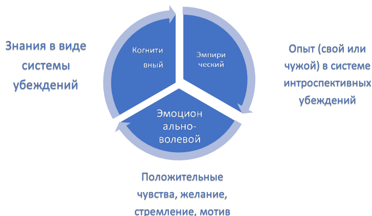
Рис. 1 Компоненты в динамическом конструкте «Вера»

На рис. 1 изображен конструкт «Вера», состоящий из трех компонентов