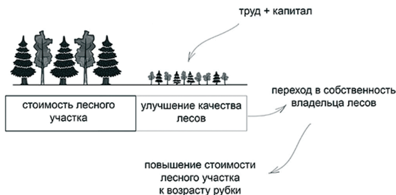
Рис. 2. Содержание лесоводственной деятельности (лесовосстановление и рубки ухода)

Обратный процесс происходит в случае максимизации будущих потребностей в древесине, т.е. приложение труда и капитала к осуществлению мероприятий по лесовосстановительной деятельности. Такие мероприятия повышают ожидаемую стоимость лесного участка к возрасту рубки (возраст финансовой спелости) в сравнении с ожидаемой стоимостью при текущей позиции (в отсутствии лесовосстановительных мероприятий). Если в процессе, представленном на рис. 1 арендатор взамен приложенных труда и капитала получает стоимость изымаемой древесины, то при лесовосстановительных мероприятиях результат приложения труда и капитала остается у владельца лесов, которым лесозаготовитель не является, учитывая институт арендного пользования лесным участком (см. рис. 2) [13].