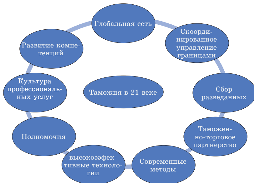
Рис. 2 Основные составляющие таможни XXI в.