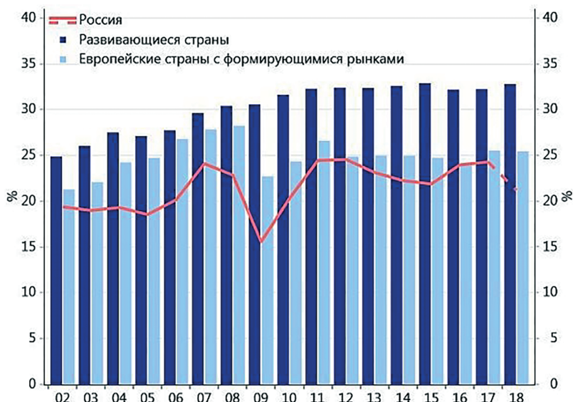
Рис. 2. Доля инвестиций в ВВП России по сравнению с другими странами

Основными источниками инвестиций в РФ вплоть до настоящего времени остаются собственные средства предприятий. По некоторым оценкам их доля в общем объеме инвестиций более 50 %. На банковское кредитование приходится около 10 % и ниже, что объясняется высокими реальными ставками. Анонсированные масштабные инвестиции в инфраструктурные проекты (6,3 трлн р. в период 2019–2024 гг.) планируется примерно на 50 % профинансировать за счет средств бюджета, что приведет к увеличению доли государственных инвестиций как источника инвестиций до 18 % [4; 5].