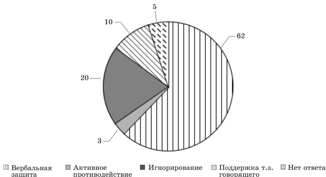
Рис. 2. Анализ ответов всех испытуемых на вопрос: «Какова ваша реакция, если, будучи на отдыхе за границей вы услышите от одного из местных жителей нелестные отзывы о вашей Родине?», в %

Рассмотрим сравнительный анализ ответов молодежной и зрелой групп на вопрос «Какова ваша реакция, если, будучи на отдыхе за границей вы услышите от одного из местных жителей нелестные отзывы о вашей Родине?» (рис. 3).