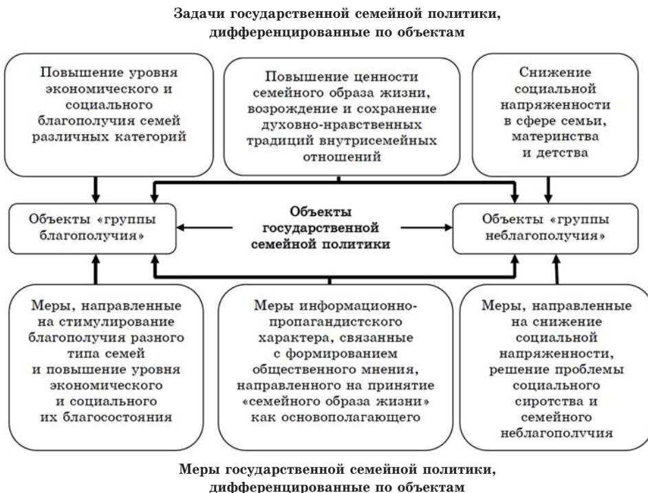
Рис. 3. Дифференцированный подход к формированию и реализации государственной семейной политики в Иркутской области

Это в свою очередь подразумевает дифференциацию мер семейной политики и критериев оценки последствий ее реализации для различных категорий семей и других объектов управленческой деятельности: социальных сирот, неблагополучных семей, родителей, лишенных прав и других.