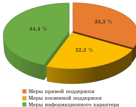
Рис. 1. Распределение мер семейной политики, реализуемых в рамках первого этапа Концепции семейной политики (Составлено по данным URL: http://irkobl.ru/sites/society/konzeperzia_family_politic/ )

Анализ показал, что меры семейной политики, реализуемые в России в настоящее время, можно разделить на меры прямой поддержки, меры косвенной поддержки и меры информационного характера (рис. 1).