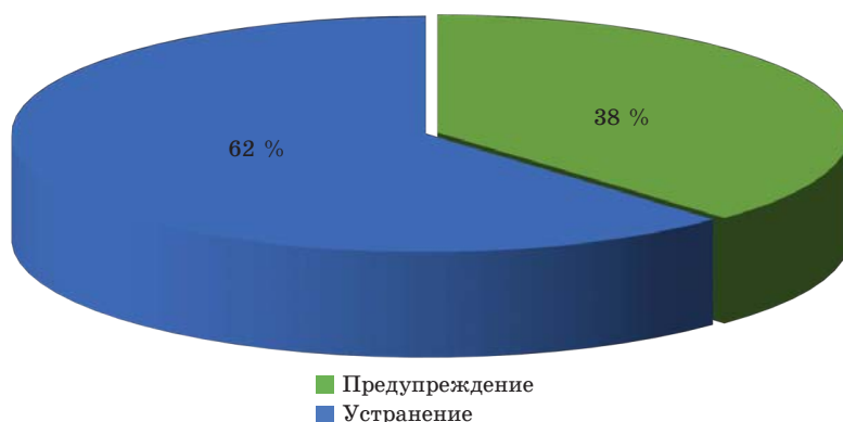
Рис. 2. Соотношение превентивных мер и мер решения проблем, выделенных в Концепции семейной политики Иркутской области до 2025 года (Составлено по данным URL: http://irkobl.ru/sites/society/konzeptzia_family_politic/ )

Меры семейной политики Иркутской области в зависимости от характера проблем, на которые направлены эти мероприятия, можно условно разделить на профилактические мероприятия, результатом которых является недопущение возникновения проблемы, и меры, направленные на решение уже существующих проблем (рис. 2). Большая часть мер направлена как раз на решение существующих проблем, а не на предупреждение новых.