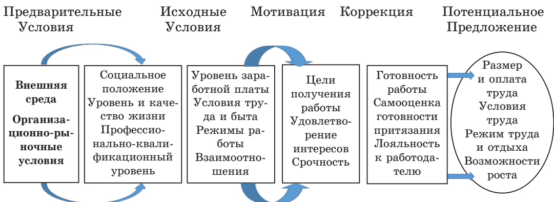
Рис. 2. Процесс формирования индивидуального предложения

В этом случае на завершающем этапе можно определиться, какие параметры конкретного рабочего места наиболее предпочтительны для кандидата занять рабочее место. Учет всех вышеперечисленных факторов может определить потенциальный уровень индивидуального предложения на рынке труда (рис. 2).