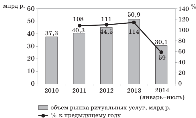
Рис. 2. Объемы рынка ритуальных услуг в 2010–2014 гг.