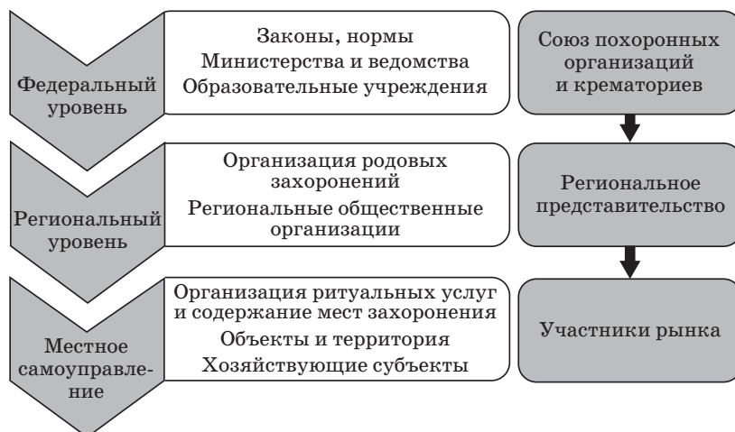
Рис. 3. Структурно-функциональная схема организации похоронного дела в Российской Федерации

На уровне субъектов РФ регулирование отрасли практически не осуществляется. Этот пробел необходимо восполнить, вернув региональные органы исполнительной власти в систему управления отраслью и наделив их определенными полномочиями.