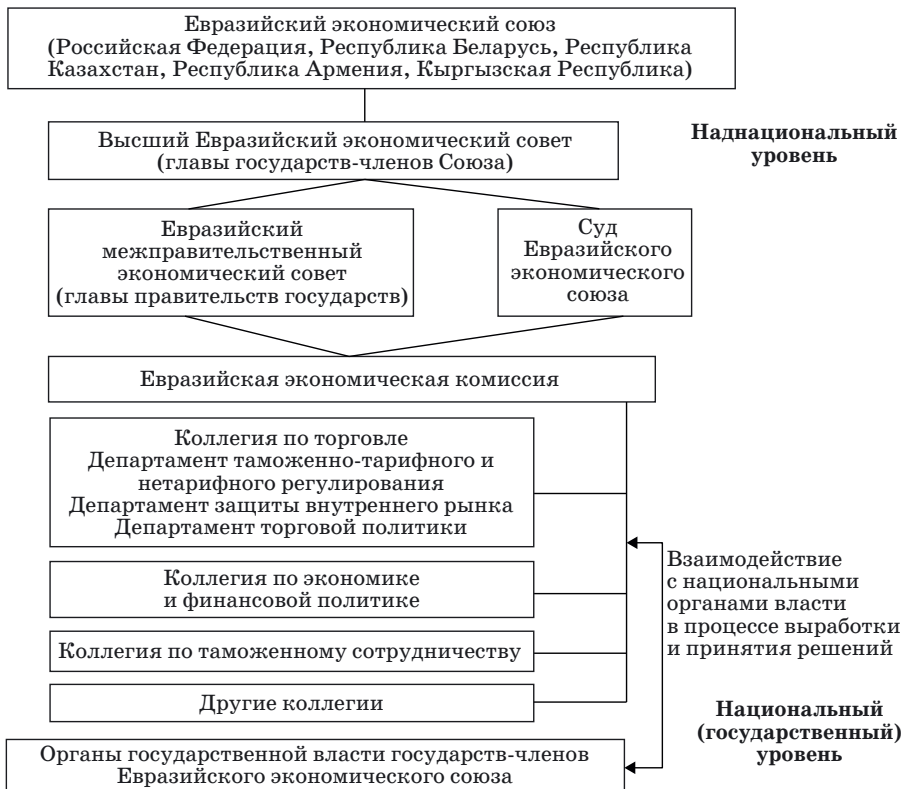
Рис. 3. Уровни регулирования экспортно-импортных операций и органы управления Евразийского экономического союза

экономическая комиссия 8 (ЕЭК), которая имеет статус наднационального органа управления и в своей деятельности руководствуется интересами стран-участниц проекта евразийской экономической интеграции в целом (рис. 3).