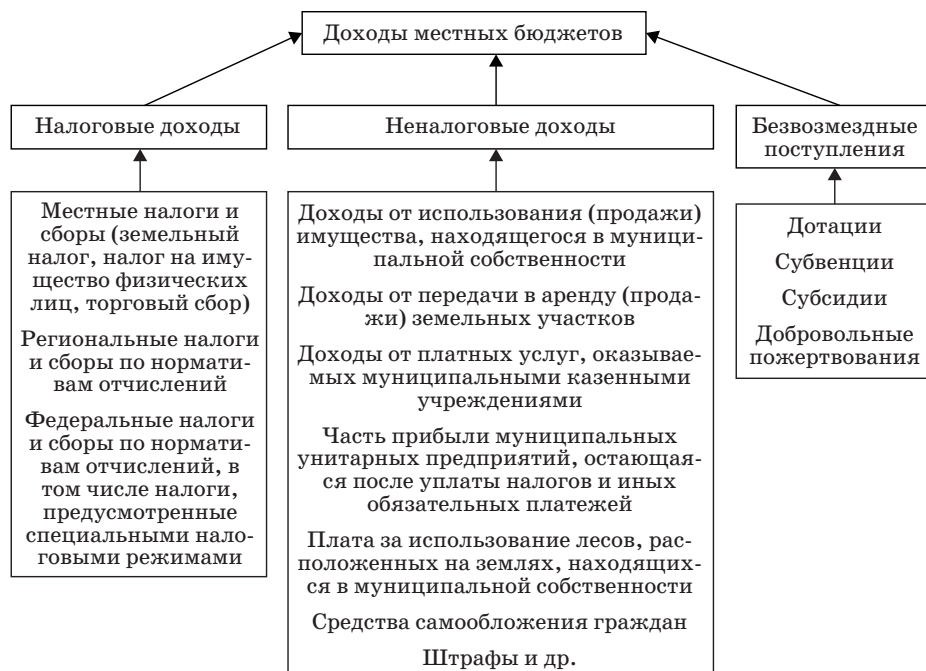
Рис. 1. Схема формирования доходной части местных бюджетов

Формирование местных бюджетов осуществляется за счет трех групп доходов 3 (рис. 1).