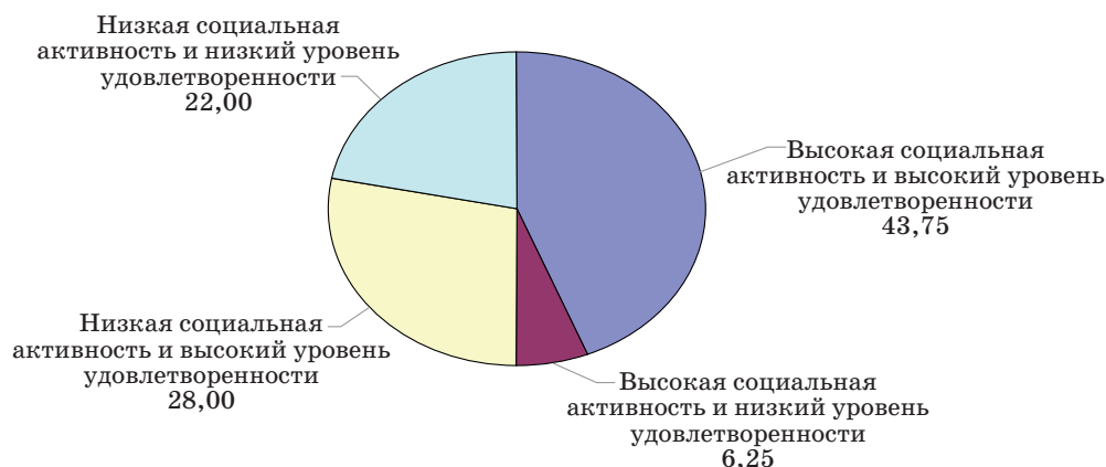
Рис. 2. Результаты распределения опроса

В результате проведенных вычислений все испытуемые были разделены на четыре кластера (рис. 2). Так, у 43,75 % опрошенных наблюдается высокий уровень удовлетворенности. Это связано с тем, что для участников опроса характерна высокая социальная активность. Только 6,25 % опрошенных с высокой социальной активностью замечается низкий уровень удовлетворенности. При низкой социальной активности также наблюдается высокий уровень удовлетворенности у 28 % молодежи сельской местности. Для 22 % всех опрошиваемых характерен низкий уровень удовлетворенности с низкой социальной активностью.