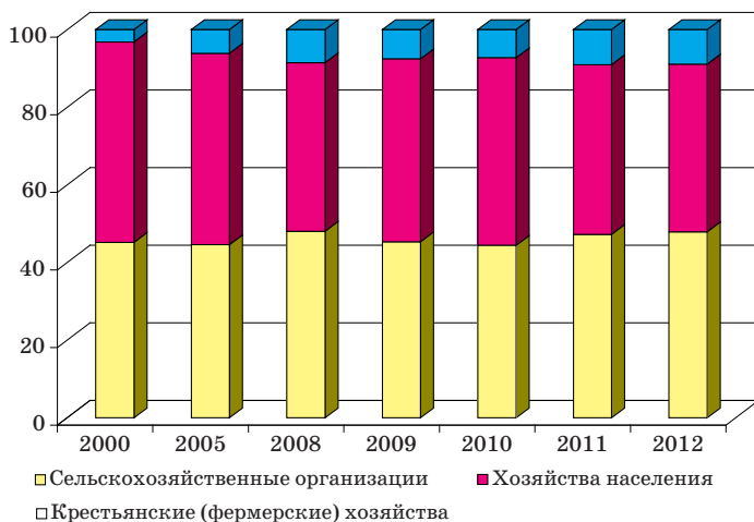
Рис. 1. Структура сельскохозяйственной продукции по категориям хозяйств в 2000–2012 гг., %

Заметно увеличивается доля производимой фермерами сельскохозяйственной продукции в общем совокупном объеме выпуска (рис. 1). При этом фермерские хозяйства наряду с личными подсобными хозяйствами уже долгое время обеспечивают более половины общего объема произведенной в России сельскохозяйственной продукции.