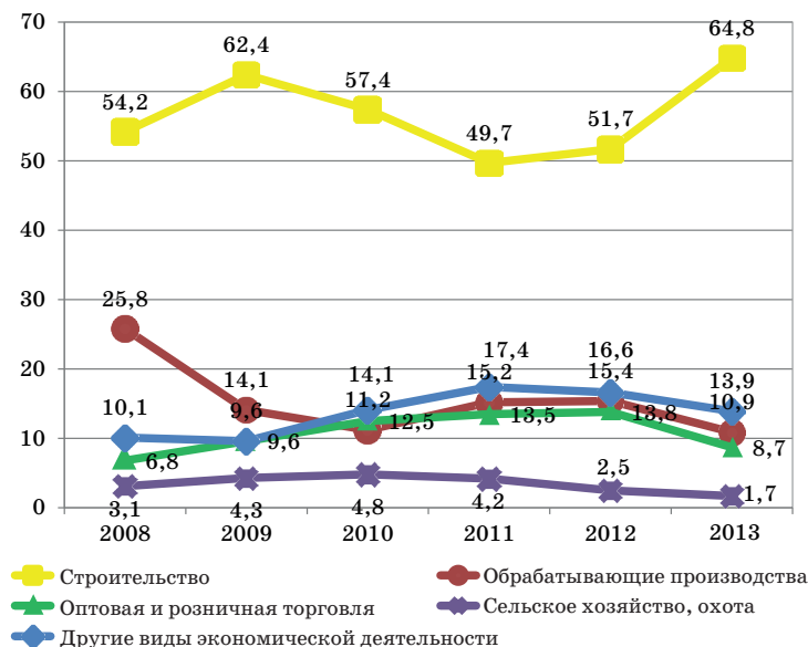
Рис. 1. Структура иностранной рабочей силы по видам экономической деятельности в 2008–2013 гг., %

Анализ основных сфер занятости мигрантов в регионах Сибири свидетельствует о том, что сибирский рынок труда структурируется так же, как и российский. Трудовые мигранты заполняют «непрестижные ниши», которые характеризуются в основном тяжелыми условиями работы и низким уровнем оплаты труда, на которые не всегда соглашаются местные жители. Как показано на диаграмме (рис. 1), в 2008–2013 гг. существенных структурных сдвигов по отраслям привлечения трудовых мигрантов не наблюдается.