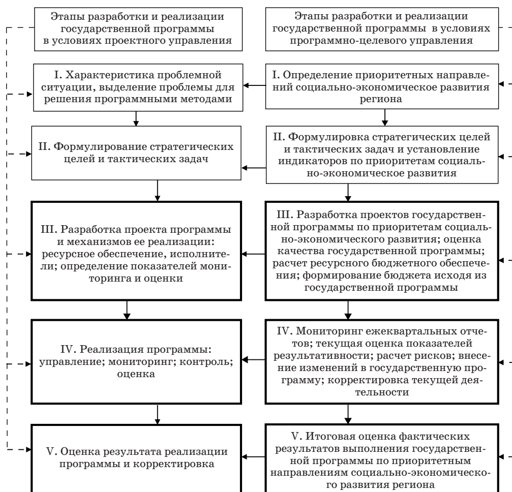
Рис. 2. Алгоритм внедрения элементов бюджетирования, ориентированного на результат, в программно-целевое управление

На уровне региона бюджетирование, ориентированное на результат, при разработке государственных программ по приоритетным направлениям социально-экономического развития требует предварительной оценки их качества; определения целей и задач в индикативной форме; учета рисков невыполнения и корректировки текущей деятельности государственных органов. Это позволило выстроить алгоритм внедрения элементов бюджетирования, ориентированного на результат, при разработке государственных программ по этапам программно-целевого управления (рис. 2).