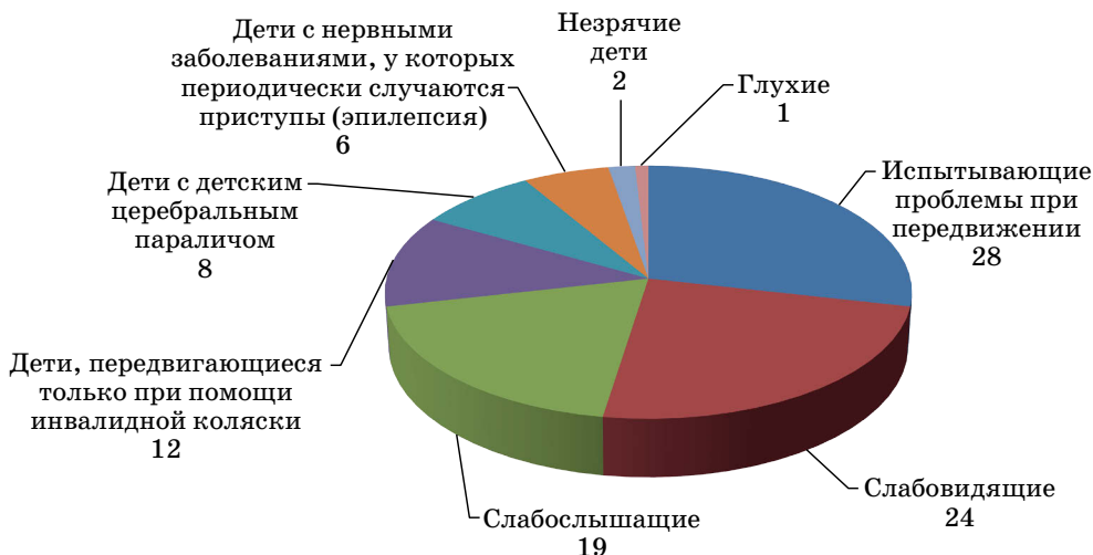
Рис. 2. Распределение ответов на вопрос «С какими заболеваниями могут быть допущены дети для получения образования в массовой образовательной школе?», %

получению образования в массовой общеобразовательной школе (рис. 2). Большинство опрошенных родителей и учителей при этом имеют в виду детей-инвалидов с ограничениями легкой и средней степени тяжести, т. е. детей, которые практически не потребуют дополнительного внимания и дополнительных условий при совместном обучении. Если мы рассматриваем всю группу детей с инвалидностью в целом, то допускают возможность совместного обучения почти две трети респондентов. Согласных с совместным обучением детей с тяжелыми нарушениями (незрячих, неслышащих, передвигающихся на инвалидной коляске) всего 15 %.