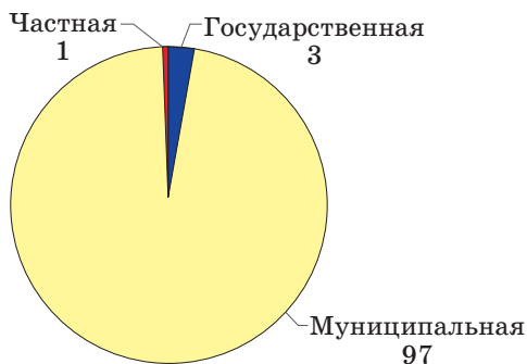
Рис. 3. Структура дошкольных образовательных учреждений по формам собственности в Иркутской области в 2012 г., %

Согласно долгосрочной целевой программе «Строительство объектов социальной сферы на 2013–2017 годы» в г. Иркутске предусмотрено возведение 13 дошкольных образовательных учреждений на 2 420 мест. До конца 2014 г. планируется ввести 1 780 мест за счет строительства пристроев к зданиям существующих детских садов. Существенная роль в решении проблем дошкольного образования может принадлежать частным ДОУ. Однако в настоящее время сеть частных учреждений не так велика (рис. 3) и не может в полной мере обеспечить возрастающую потребность в местах в ДОУ.