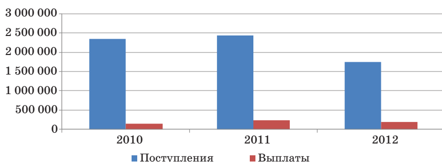
Рис. 3. Динамика рынка страхования опасных производственных объектов в России в 2010–2012 гг., тыс. р.