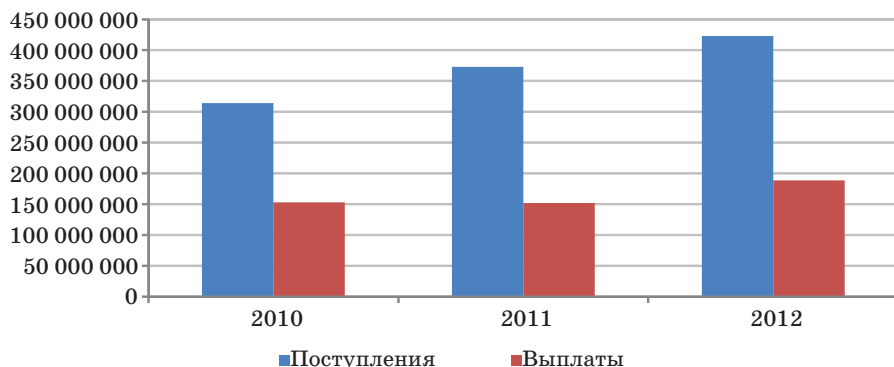
Рис. 1. Динамика страховых взносов и страховых выплат по имущественному страхованию в России за 2010–2012 гг., тыс. р.