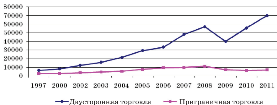
Рис. 1. Внешняя торговля России и Китая, млн дол.