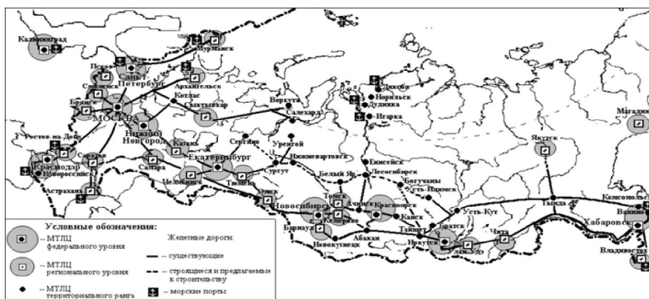
Рис. 4. Схема российской транспортно-логистической сети

Компании в ТТЛП должны сопровождаться поддержкой государства. Интересен опыт КНР по поддержке приграничных структур бизнеса. На китайской территории компании, имеющие статус компании приграничной торговли, первоначально, в течение более десятка лет, получали льготы в виде 50% уплаты импортной пошлины и НДС на товары, ввозимые из соседних государств. Получение указанных льгот и таможенное оформление импорта происходило в пограничных пунктах пропуска, а не по месту назначения грузов. Это притягивало капиталы из внутренних районов Китая на приграничные территории. Даже когда импортная пошлина на поставку круглого леса из России равна нулю, компании, расположенные во внутренних районах обязаны прибегать к посреднической помощи компаний приграничной торговли, для которых упрощена процедура таможенного оформления товаров. Поэтому вся пограничная торговля сконцентрирована в немногих пунктах-переходах провинций Хэйлунцзян, Цзилинь и Автономного района Внутренней Монголии на российско-китайской границе. Здесь же в рамках международных компаний технико-экономического сотрудничества (компании приграничной торговли) располагаются информационные центры, отслеживающие рыночную ситуацию по контрагентам, объему сделок, цене. Таким образом, владея информацией, определяя ценовое давление и разобщая российских конт-