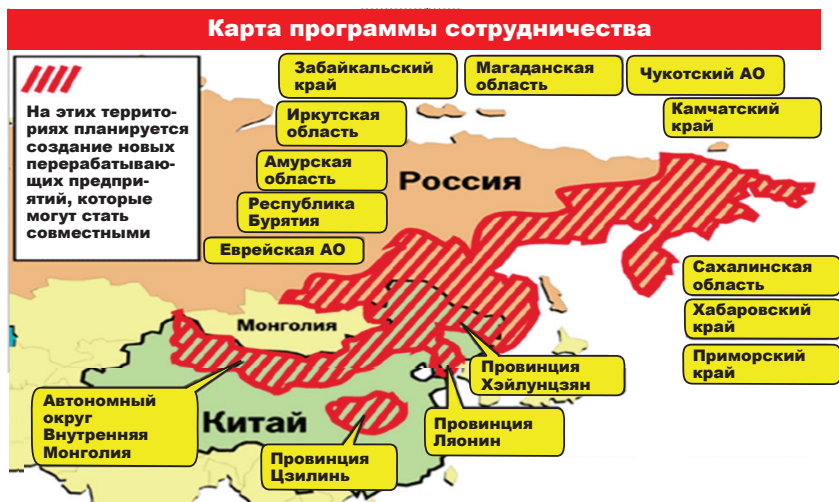
Рис. 5. Карта инвестиционного сотрудничества восточных регионов России и северо-восточных провинций Китая

Реализация стратегии соразвития РФ и КНР подвигло российско-китайские региональные отношения на новую ступень трансграничных взаимодействий — инвестиционное сотрудничество. Главами правительств 17 июня 2009 г. утвержден План российско-китайского инвестиционного сотрудничества [4]. Согласно ему российские приграничные регионы реализуют свои природно-сырьевые преимущества (рис. 5).