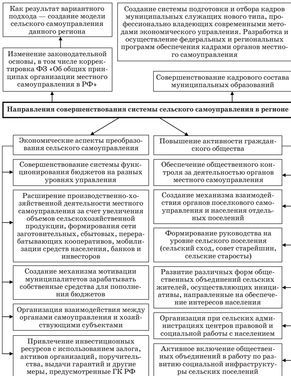
Рис. 2. Направления совершенствования системы сельского самоуправления в регионе

строго эффекта. Вовлечение населения в местное самоуправление требует достаточно долгой и кропотливой организаторской, экономической и воспитательной работы.