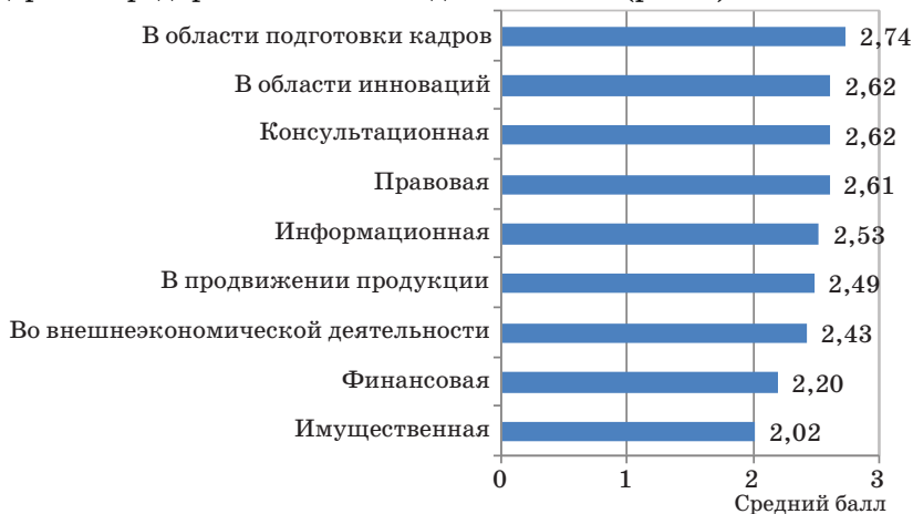
Рис. 2. Оценка уровня развития видов поддержки предпринимательской деятельности

По мнению 60% респондентов, развитие малых предприятий сдерживают высокие налоги и несовершенство налоговой системы в целом. Далее идут такие глобальные проблемы, как общая экономическая нестабильность в стране (52%), а также низкий платежеспособный спрос населения (46%). Рассматриваемая автором проблема доступности кредитов также сильно беспокоит руководителей: сложности с получением кредитов отметили 38% опрошенных. Руководителям предприятий малого бизнеса также предлагалось оценить по пятибалльной шкале уровень развития видов поддержки предпринимательской деятельности (рис. 2).