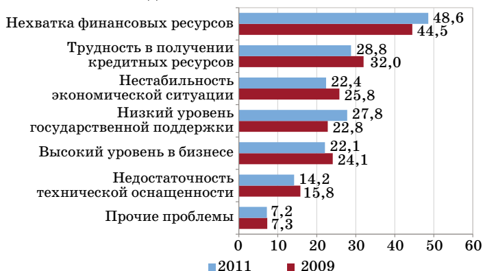
Рис. 1. Распределение ответов респондентов на вопрос о проблемах ведения МСБ в Монголии, %

ную поддержку (5,0% респондентов). Такой результат показывает, что МСБ Монголии остро нуждается в финансовых ресурсах и поддержке со стороны государственных и банковских организаций. Во многом, такая ситуация связана с экономическим кризисом, разразившимся в мире в 2008–2009 гг. и не обошедшим своим влиянием Монголию.