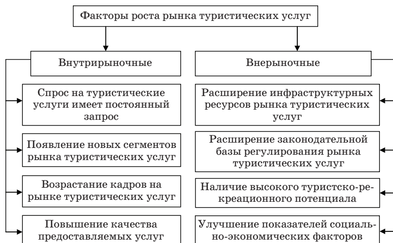
Рис. 1. Факторы роста рынка туристических услуг

Однако в современных условиях, начиная с 2000-х гг. наблюдается положительная тенденция увеличения внутреннего и въездного туризма, улучшается качество обслуживания, развиваются различные виды туризма и рекреации, осваиваются новые маршруты туров. Такому скачку в развитии рынка туристических услуг поспособствовало влияние ряда положительных факторов роста рынка туристических услуг (рис. 1).