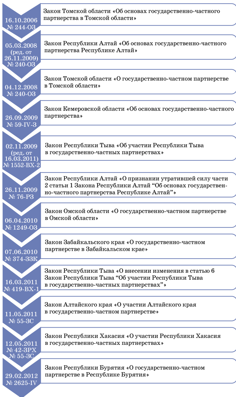
Рис. 2. Законодательные инициативы субъектов Российской Федерации

«О муниципально-частном партнерстве в городском округе «город Улан-Удэ» № 578-58 от 15 февраля 2007 г. (ред. от 14 июня 2007 г.); постановление Администрации г. Улан-Удэ «Об утверждении Положения о порядке заключения соглашений о муниципально-частном партнерстве в городском округе «город Улан-Удэ» № 248 от 21 мая 2007 г.).