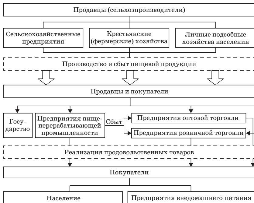
Рис. 1. Взаимодействие субъектов продовольственного рынка

ные предприятия различных форм собственности, хозяйства населения, крестьянские (фермерские) хозяйства, предприятия сферы агробизнеса, включающие переработку, хранение, транспортировку и сбыт продукции, государственные учреждения, а также отдельные индивидуумы. Взаимодействие субъектов продовольственного рынка представлено на рис. 1.