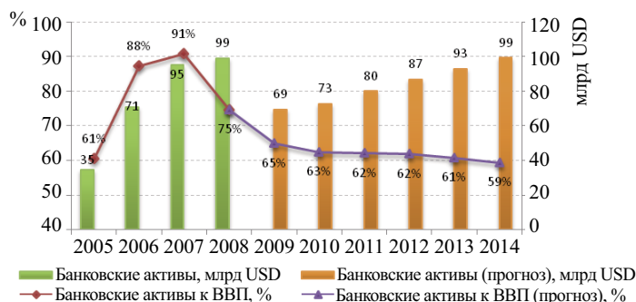
Рис. 2. Прогноз динамики банковских активов и ВВП Республики Казахстан до 2014 г.